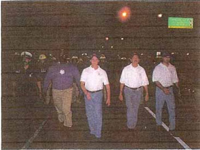
Personal de NYFD en desfile de la Vigilia por la Patria