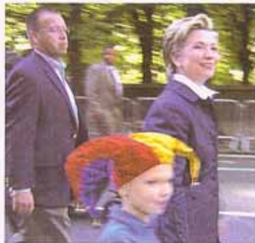
Un détour d'une avenue de New York. Hilary Clinton

arlent français dont un indien Navajo qui avait passé deux ans en France". vis donc à ceux qui massacrent la langue dite de Shakespeare et qui néanmoins voudraient découvrir Amérique !