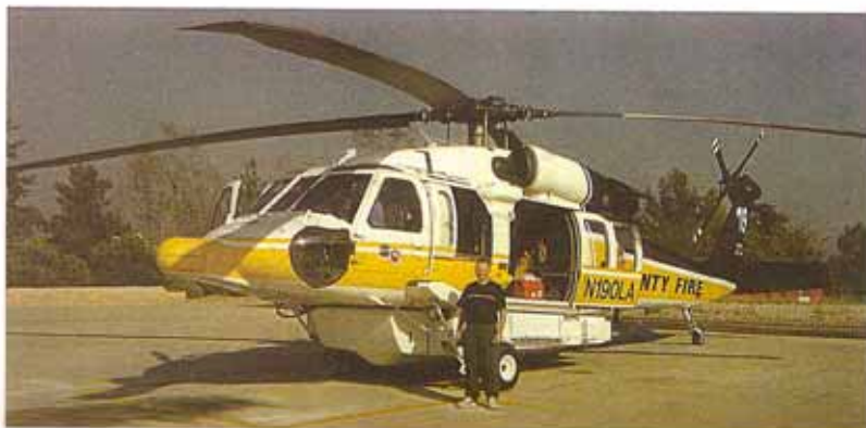
Un hélicoptère des pompiers pour survoler Los Angeles

par terminator Shwarzenegger. Parti pour pédaler sur 5000 kilomètres d'asphalte, Joël n'en a donc parcouru que 3125 car les conditions climatiques ont été plus dures que prévues. Les températures ont varié de 50 degrés dans le sud à 0 dans le nord. Cela explique quelques défaillances du sportif qui a parcouru quelques-uns de